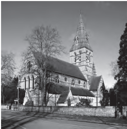
Centro Oxford de Estudios de Misiones

otro nivel intensamente frustrante. El desafío de la corrupción judicial, así como la corrupción en general, requería un enfoque holístico que excedía la óptica estrecha, formalista y tecnocrática del Banco Mundial. Las cuestiones profundas de la ética social, los valores y normas culturales y sociales, tan evidentes y fundamentales, no eran relevantes, mucho menos prioritarios, para los economistas del Banco Mundial. Como se verá, los resultados hablan por sí mismos.