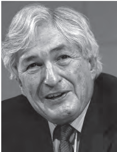
James D. Wolfensohn, Presidente del Banco Mundial 1995–2005

No hay duda de que la corrupción es tema preeminente en el mundo actual. En prácticamente todos los países, uno lee a diario en los periódicos alguna noticia de corrupción. De acuerdo a encuestas realizadas entre 2014 y 2016, ha sido considerado el problema más serio y el tema más hablado en todo el mundo. 1 En la Argentina, mi país de origen, como en tantos otros países latinoamericanos, es noticia de todos los días. La corrupción es un fenómeno universal que afecta a personas, instituciones y naciones. No es particular de ningún grupo de individuos, cultura o país. Todas las sociedades la padecen, aunque de distintas formas e intensidades. Es una enfermedad social, un virus que ataca las estructuras y cimientos vitales que permiten que una sociedad funcione y se desarrolle política, económica y socialmente. No asombra que haya atraído la atención de organismos internacionales, políticos, activistas y académicos.